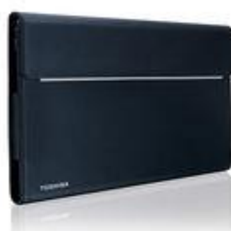
Funda dynabook con bolsillo para X-series (12" a 14") (PX1900E-2NCA)