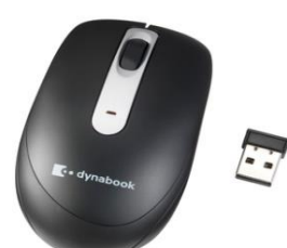
Ratón óptico inalámbrico W90 (PA5347E-1ETE)