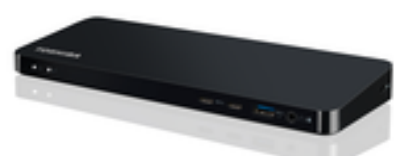
Docking dynabook USB-C (PA5356E-1PRP)